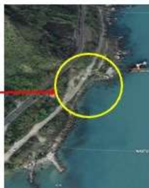
Posizione Parcheggi Nuotata dei Trabocchi 23 Luglio 2022

Il campo gare è raggiungibile dai parcheggi tramite la ciclopedonale Via Verde dei Trabocchi